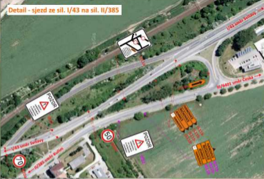
Detail - sjezd ze sil. I/43 na sil. II/385

SITUACE PŘECHODNÉHO DOPRAVNÍHO ZNAČENÍ I/43 BRNO, UL. HRADECKÁ – OPRAVA KRYTU VOZOVKY V KM 1,23 – 5,00, VČ. OPRAVY DILATAČNÍCH ZÁVĚRŮ U MOSTŮ 43-005.1 A 43-005.2 ETAPA II - OBJÍZDNÁ TRASA